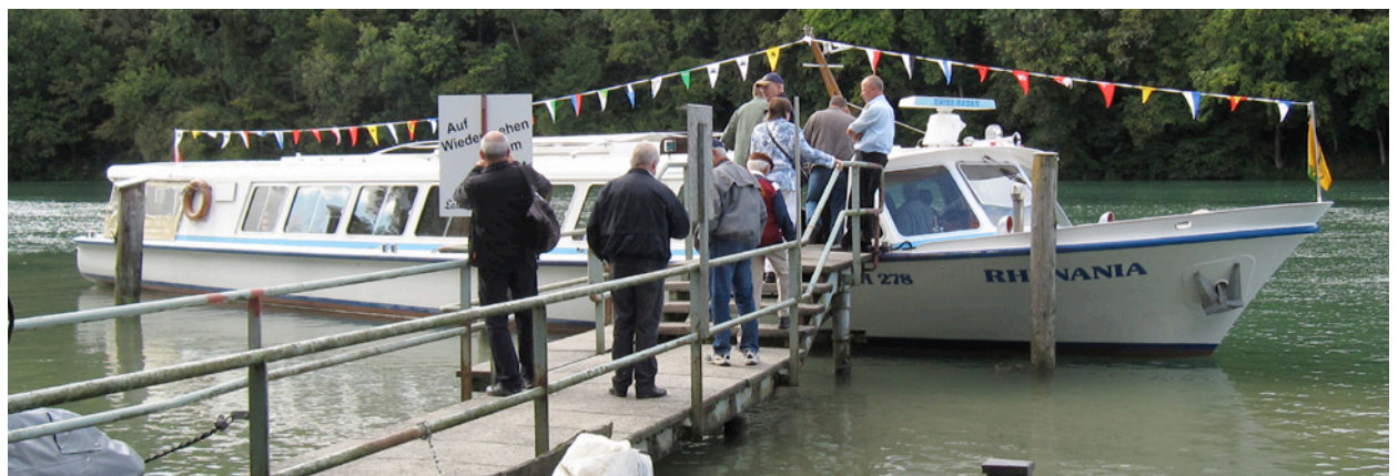
Einschiffen beim Kraftwerk Eglisau