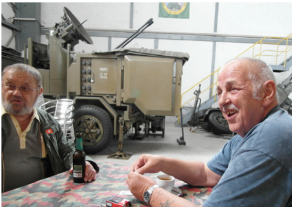
Alter und neuer Anlagewart Im Militärmuseum