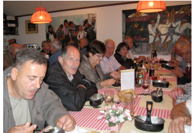
Mittagessen im Festungsbunker: Spatz aus der Gamelle