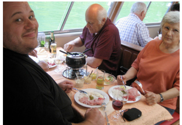
Fondue Chinoise auf der Rhenania: Guet und Gnuet