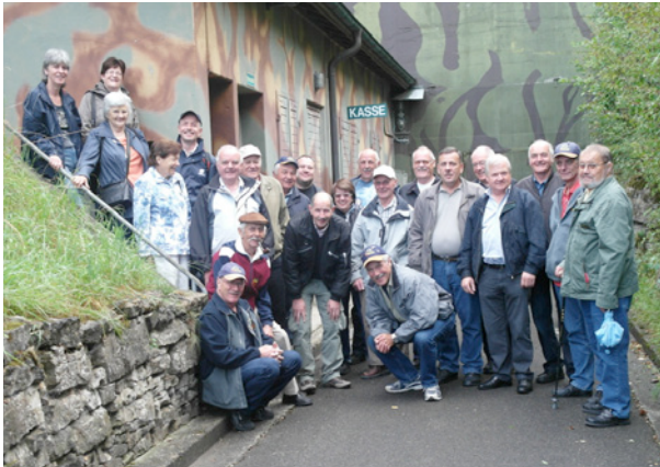
Bereit für die Expedition „Zurück in den 2. Weltkrieg“

Am Samstag, 27. August 2011 bestiegen 24 Teilnehmende den Nüssli-Car für die Besichtigung vom Festungsmuseum Reuental und dem Militärmuseum Full. Für die männlichen Teilnehmer wurden viele Erinnerungen an die eigenen Militärdienstzeit wieder wach, während die weibliche Begleitung deren Begeisterung für das gut erhaltene und anschaulich präsentierte Bunkersystem und die vielen Waffen und Kriegsgegenstände nicht immer nachvollziehen konnte. Immerhin schmeckte der Spatz aus der Gamelle und die obligatorische Crèmeschnitte zum Dessert wieder allen gleich gut. Beim Kraftwerk Eglisau bestiegen wir die Rhenania für eine idyllischen Rhein-Schiffahrt bis nach Rüdlingen und wieder zurück nach Eglisau. Beim Apéritiv und dem reichhaltigen Fondue Chinoise konnten wir die schöne Flusslandschaft geniessen und die gemütliche Schützenreise ausklingen lassen.